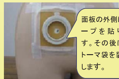
⑤全面皮膚保護剤の場合