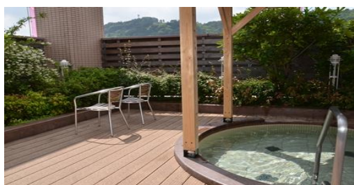
【露天風呂】【奇数日…男性、偶数日…女性】